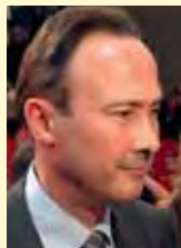
Bruno Valkeniers Vlaams Belang-voorzitter

“Een kordate aanpak van de criminaliteit blijft uit. Tot ergernis van de rechters, tot frustratie van de politie, tot onvrede van de samenleving en tot groot jolijt van de criminelen.