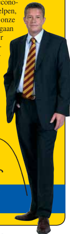
Frank Vanhecke Voorzitter Vlaams Belang

Willen wij onze economie er bovenop helpen, dan moeten we onze eigen boontjes gaan doppen. Zonder Waalse bemoeienissen. Alle Vlamingen hebben er dus belang bij dat Vlaanderen onafhankelijk wordt.