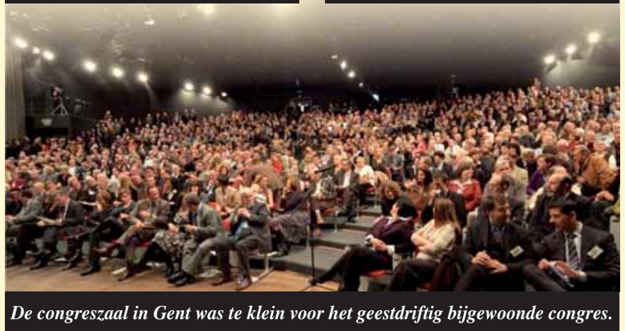
De congreszaal in Gent was te klein voor het geestdriftig bijgewoonde congres.