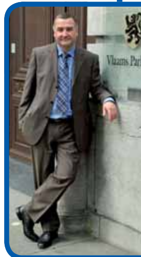
Karim Van Overmeire Vlaams Parlements lid Lijsttrekker 2009 www.karimvanovermeire.org

deren op eigen kracht' en met de campagnes die nog zullen volgen wil het Vlaams Belang de ijsbreker zijn die de route naar onafhankelijkheid open breekt. Wij rekenen op uw steun.