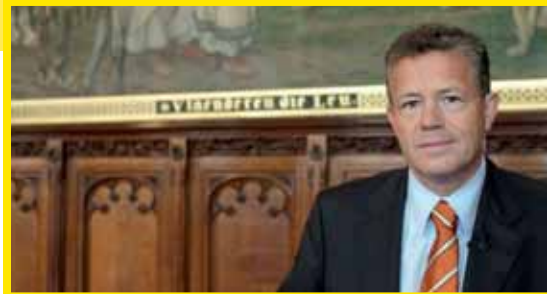
Frank Vanhecke is niet van plan zich de mond te laten snoeren.