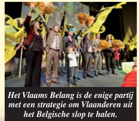
Het Vlaams Belang is de enige partij met een strategie om Vlaanderen uit het Belgische slop te halen.